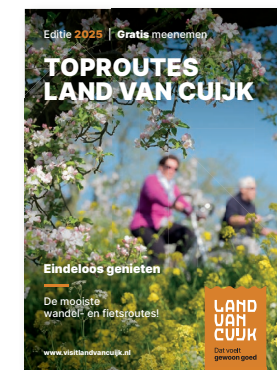
Fiets- en wandelboekje