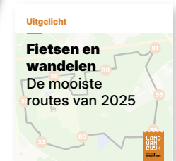
Social media bericht